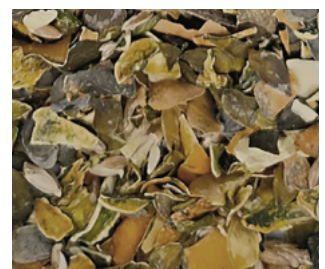
Ausgelesener Besatz nach spezifischem Gewicht, Form, Farbe